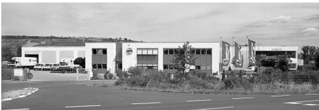
IBS Scherer GmbH v Gau-Bickelheimu

Všechny přístroje jsou certifikovány a prošly zkušebnou!